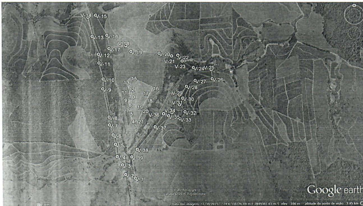
Planta de localização do loteamento dentro do perímetro urbano de São Marcos